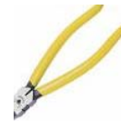
คีมตัดสายไฟ