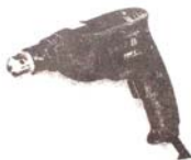
สว่านไฟฟ้า