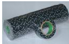
ผ้าเทปพันสายไฟ